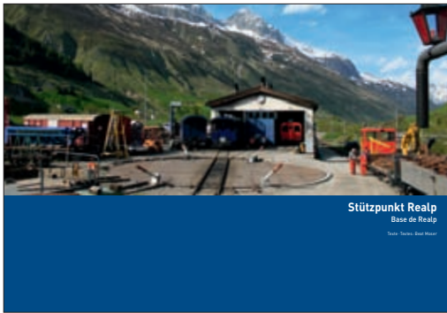
Stützpunkt Realp Base de Realp