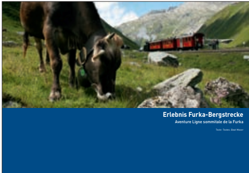
Erlebnis Furka-Bergstrecke Aventure Ligne sommitale de la Furka