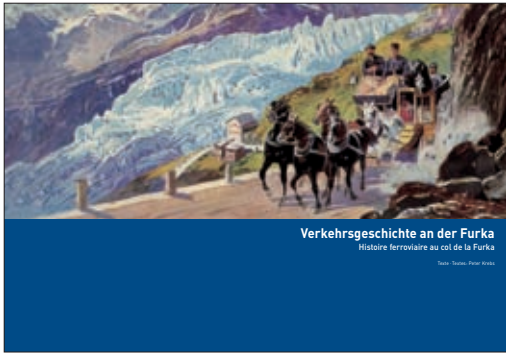
Verkehrsgeschichte an der Furka Histoire ferroviaire au col de la Furka